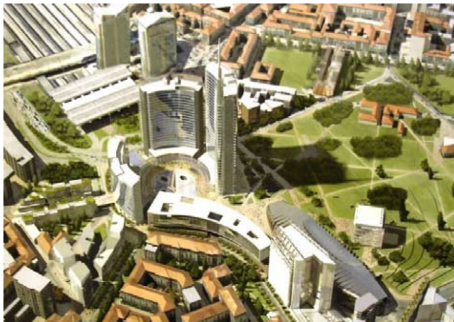
Rendering generale di Porta Nuova